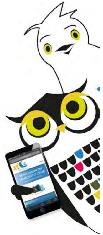
Grafik 1: Lerchen oder Eulen? Nach der Chronobiologie lassen sich Menschen in fünf unterschiedlichen Gruppen kategorisieren.